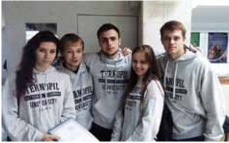
На фото: (вгорі) - за мить до початку економічного квесту; внизу - студенти ФКІТ мають вагомі здобутки у навчанні і у спорті. Разом - ми велика сила!