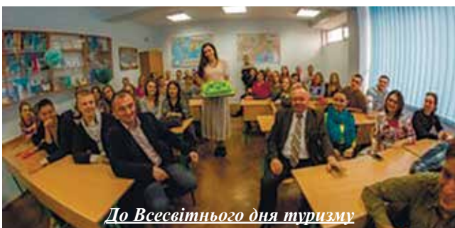
До Всесвітнього дня туризму